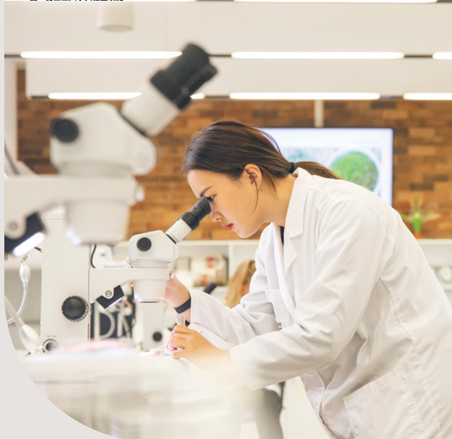
图：昆士兰大学实验室设施