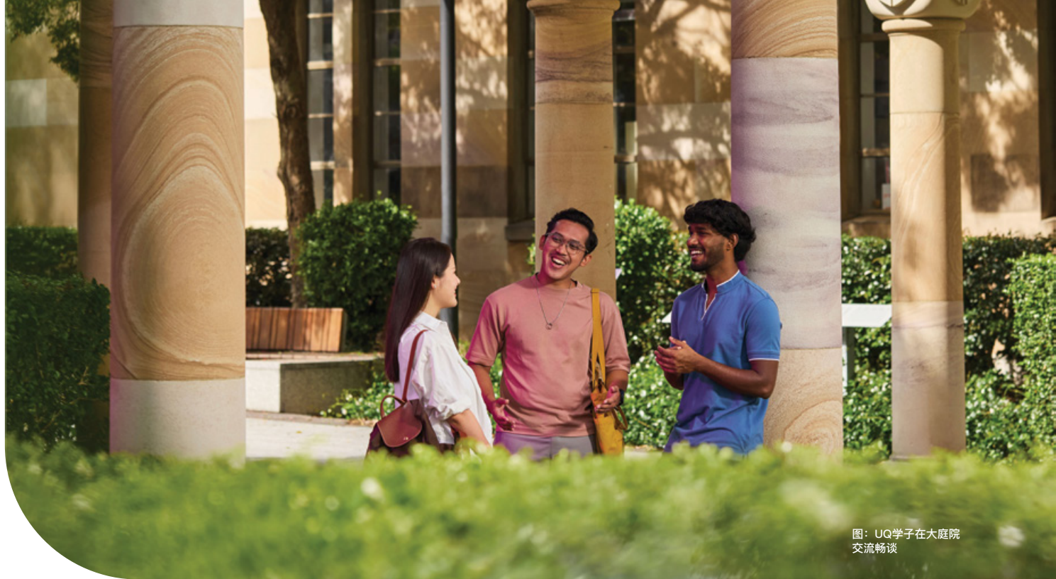
图：UQ学子在大庭院交流畅谈