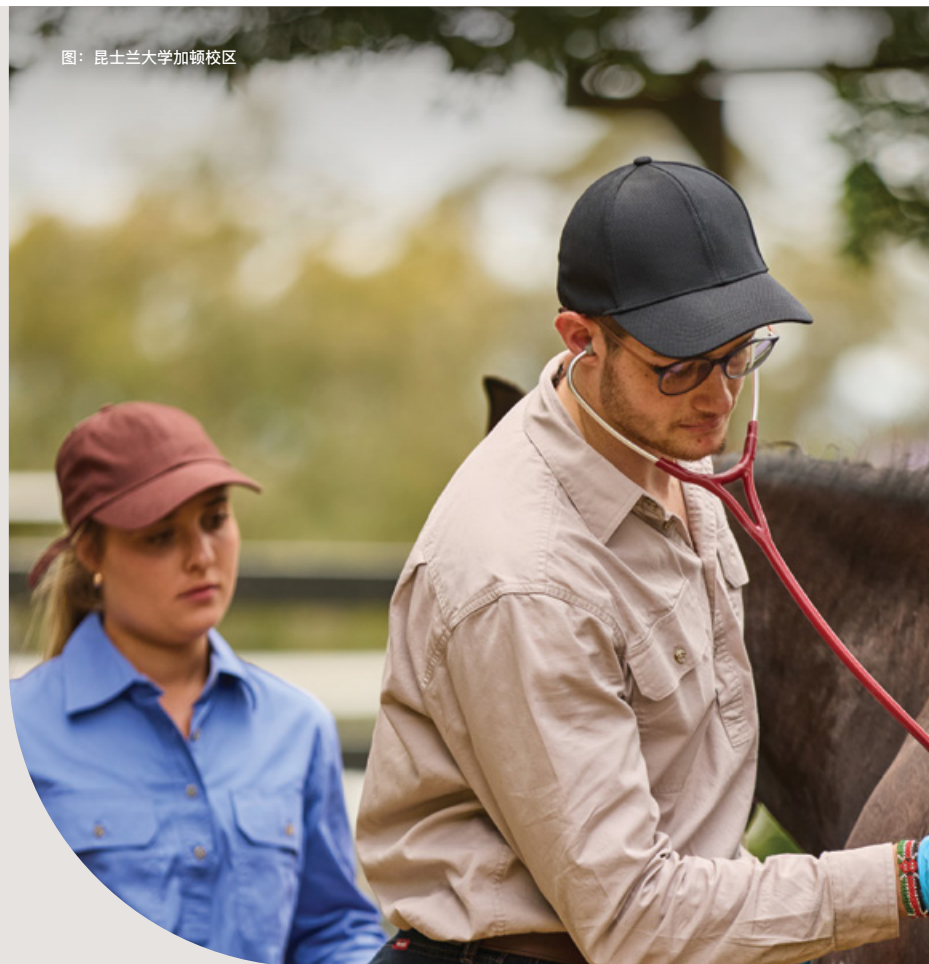
图：昆士兰大学加顿校区