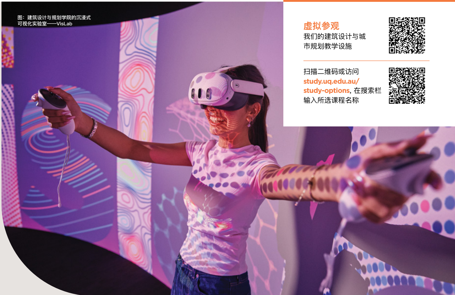
图：建筑设计与规划学院的沉浸式可视化实验室——VisLab