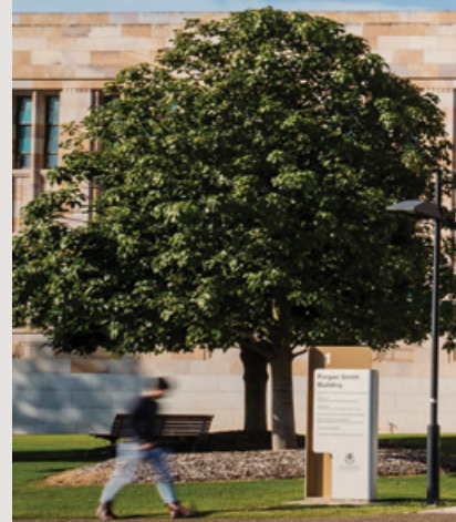
图：Forgan Smith大楼，昆士兰大学圣卢西亚校区