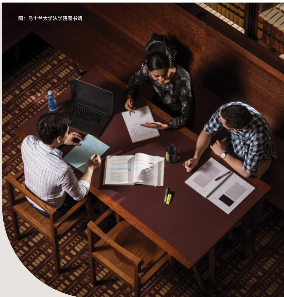
图：昆士兰大学法学院图书馆