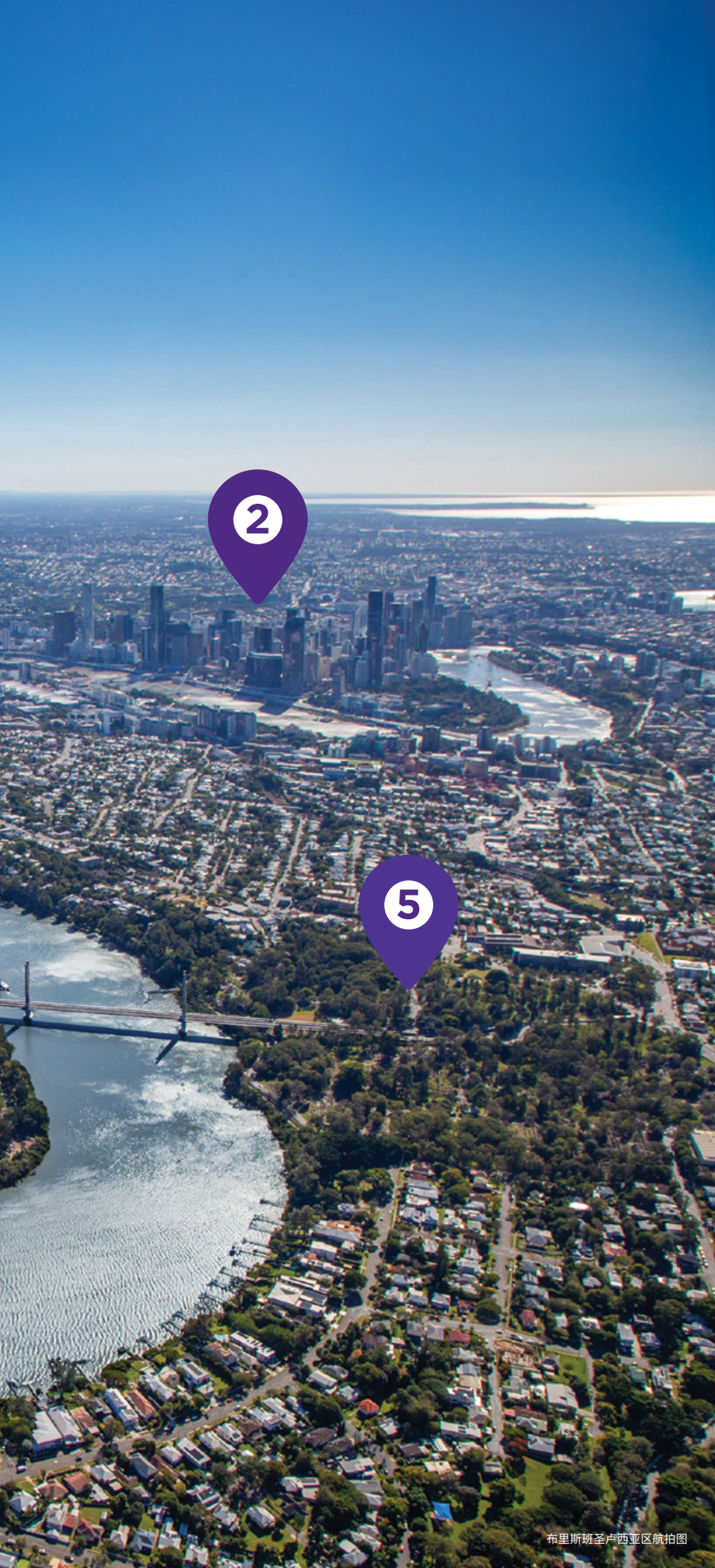
布里斯班圣卢西亚区航拍图