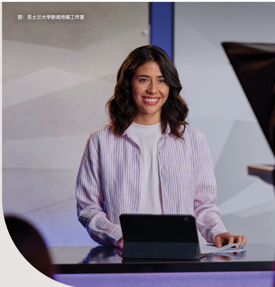
图：昆士兰大学新闻传媒工作室