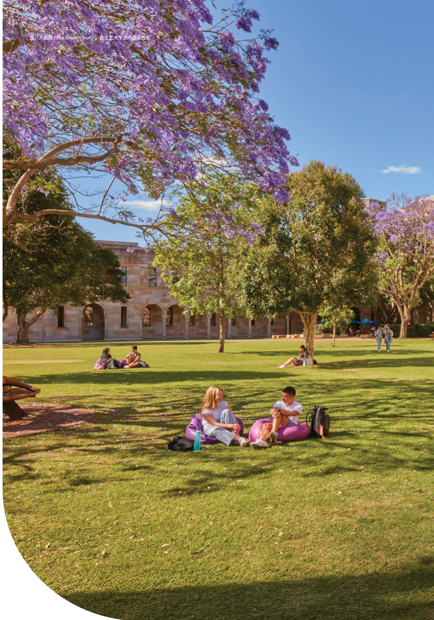
图：大庭院 (The Great Court)，昆士兰大学圣卢西亚校区