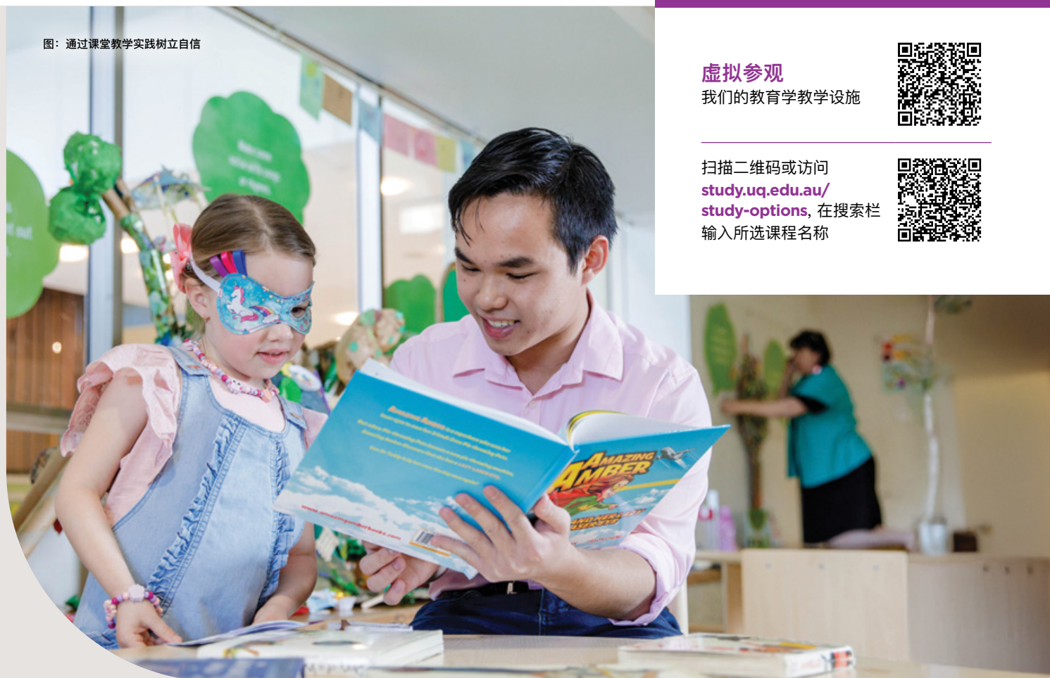
图：通过课堂教学实践树立自信